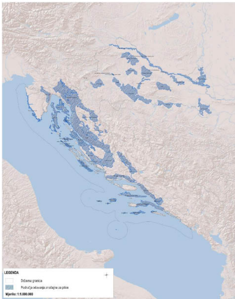
Dio 2. Područja očuvanja značajna za vrste i stanišne tipove