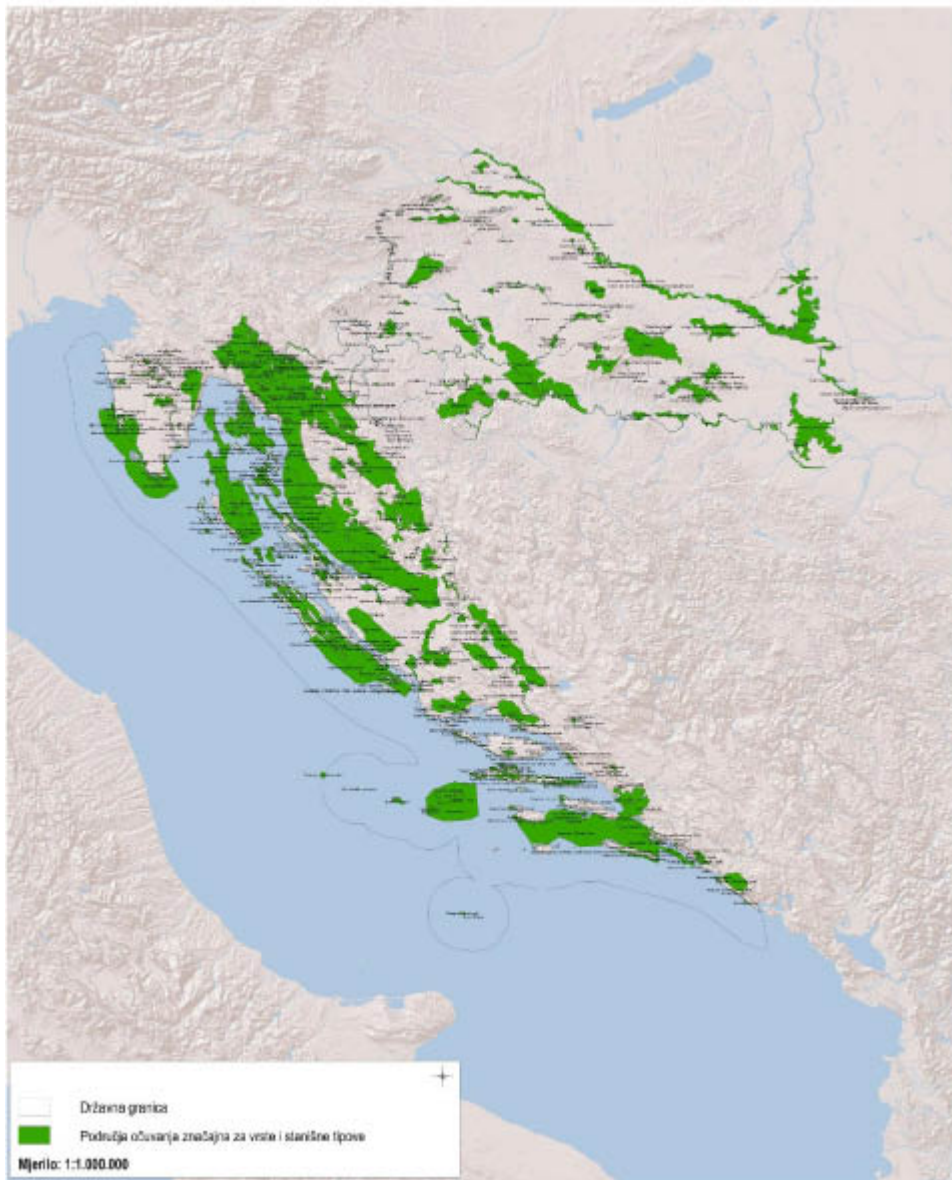
Dio 3. Vjerojatna područja očuvanja značajna za vrste i stanišne tipove